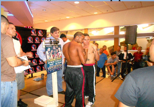
¡Boxeo Pesaje en Centro del Sur!