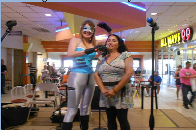
¡El Regalito Time a toda popa!