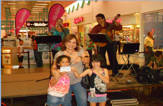
El Regalito Time - Goodbye Summer.